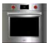
ICBSO30PM/S/PH S 759mm W 724mm G 606mm