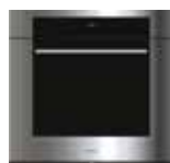
ICBSO30TM/S/TH S 759mm W 724mm G 606mm