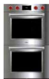
ICBDO30PM/S/PH S 759mm W 1292mm G 606mm