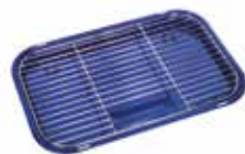
TACA WIELOFUNKCY- JNA