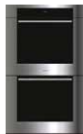
ICBDO30TM/S/TH S 759mm W 1292mm G 606mm