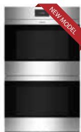
ICBDO30CM/S S 759mm W 1292mm G 606mm