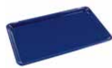
TACA DO PIECZENIA