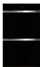
ICBDO30CM/B S 759mm W 1292mm G 610mm