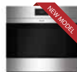
ICBSO30CM/S S 759mm W 724mm G 606mm